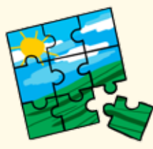
Faire des casse-têtes