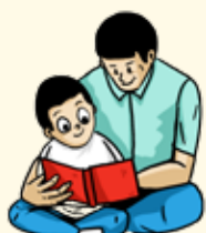
Lire des histoires