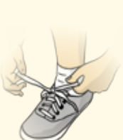
Développer mon autonomie