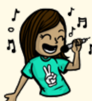
Chanter des chansons