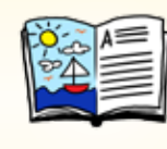
Regarder un livre