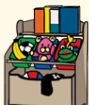
Apprendre à ranger