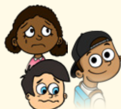
Reconnaître et nommer mes émotions