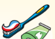
Brosser mes dents