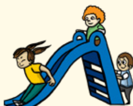
Attendre mon tour