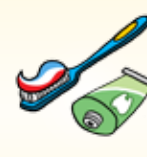
Brosser mes dents