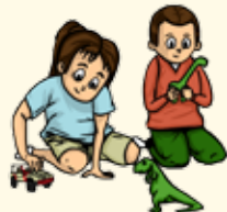
Jouer avec des amis