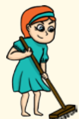
Avoir de petites responsabilités