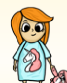
Mettre mon pyjama