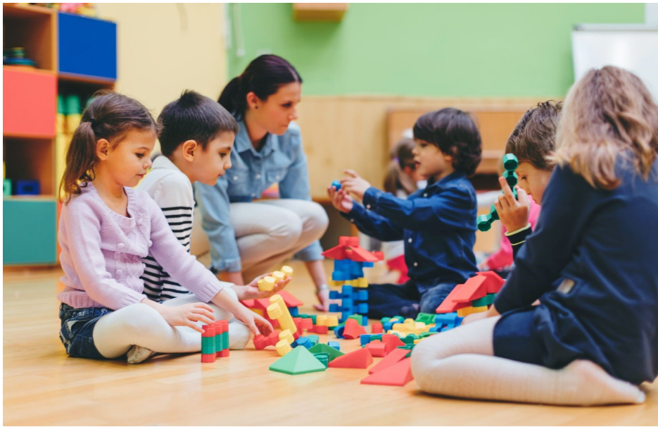
Le devoir, 18 décembre 2018. éducatrice en train de partager le jeu des enfants, en s'intéressant authentiquement à ce que lui dit l'enfant. Un gage de qualité.